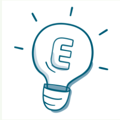
Unsere Idee der Energiewende