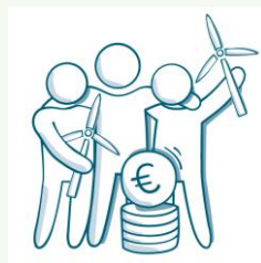
Beteiligung der Menschen vor Ort