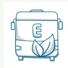
Machen wir uns gemeinsam auf die Reise