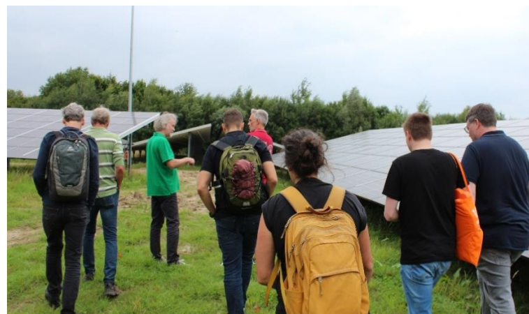
Abbildung: Die Teilnehmer*innen des PV-Freiflächen-Mentoringprogramms

Parallel müssen alle potenziellen Einnahmen berücksichtigt werden, einschließlich der zu erwartenden Stromerträge. Da sich Marktpreise, Zinssätze und Inflationsannahmen während der Projektentwicklung häufig verändern, ist es notwendig, die Wirtschaftlichkeitsberechnung regelmäßig anzupassen. Erste Kostenschätzungen werden oft auf Basis von Angeboten von Anlagenerrichtern oder technischen Berater*innen erstellt, ergänzt durch Erfahrungswerte zu Projektentwicklungskosten. Für die Berechnung selbst können sowohl einfache Online-Tools als auch professionelle Software oder selbst entwickelte Excel-Modelle genutzt werden.