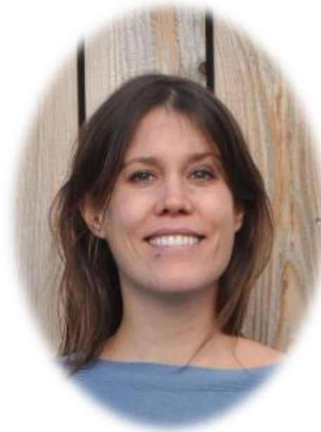
Lara Track Junior Coachin